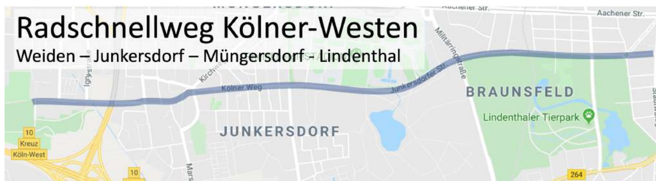
Vorschlag für einen Fahrradschnellweg im Kölner Westen

Trotz der alternativen Route durch den Stadtwald wird die Friedrich-Schmidt-Straße bereits jetzt von Fahrradfahrern stark frequentiert. Sei es, weil die Strecke entlang der Friedrich-Schmidt-Straße direkter und schneller als die Fahrt durch den Stadtwald ist, weil der Bodenbelag für Fahrradfahrer besser ist oder weil die Fahrradfahrer Konflikte mit den Fußgängern vermeiden wollen. Bei Dunkelheit bevorzugen sowieso weitgehend alle Fahrradfahrer die beleuchtete Friedrich-Schmidt-Straße dem Weg durch den Stadtwald.