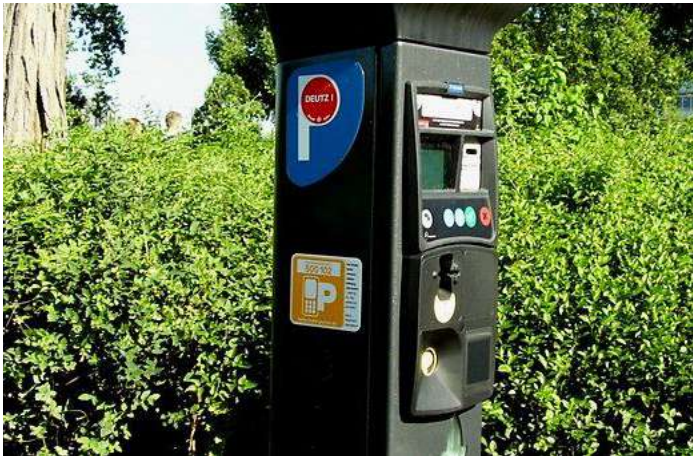
Anwohnerparken im Baumeisterviertel

Wir wünschen uns eine Parkraumbewirtschaftung für das Baumeisterviertel (zwischen Friedrich-Schmidt-Straße, Kitschburger Straße, Aachener Straße und Militärring). In diesem Gebiet finden die Anwohner immer schlechter einen Parkplatz, weil mehr und mehr Pendler ihre Autos in dem Wohngebiet abstellen um dann mit Rollern oder Klappräder zu ihrer Arbeitsstätte (insbesondere DKV) zu fahren.