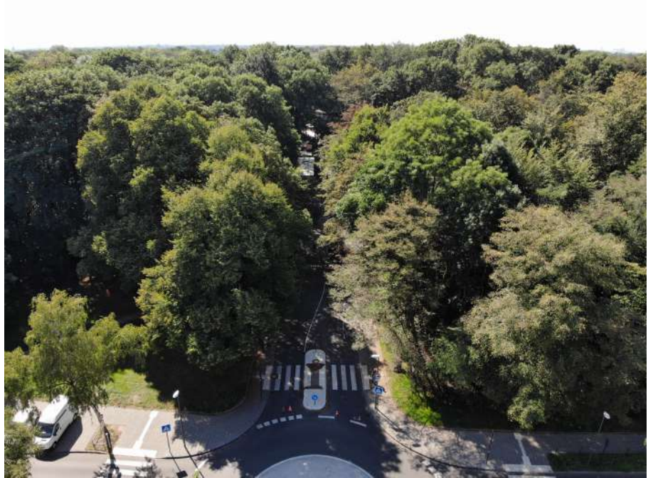
Naherholung im Stadtwald: Tempo 30 für die Kitschburger Straße

Zur Förderung der Naherholung sollte Tempo 30 im Stadtwald umgesetzt werden. In den vielen anderen Städten wurde in Naherholungsgebieten bereits vor Jahren konsequent Tempo 30 eingeführt.