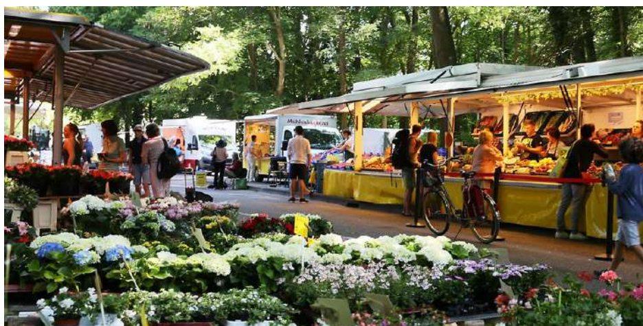
Wochenmarkt im Stadtwald

Der samstägliche Wochenmarkt auf der Kitschburger Straße ist bei Anwohnern und Händlern gleichermaßen beliebt.